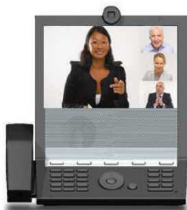
E20は直感的な操作ですぐに複数パーティーによるビデオコールが開始できるMultiWay機能をサポートしています。

モデルチェンジされたTANDBERG E20は、音声、映像、コラボレーションを1つの機器に統合したデスクホン。社員一人ひとりの生産性と日々のコラボレーションが即座に向上する、企業での大規模導入に適したソリューションです。